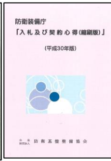
A5版 ¥1,000 (縮刷版)