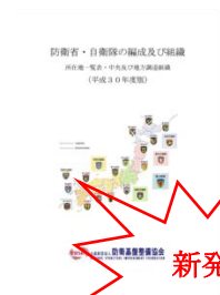
防衛省・自衛隊 の編成及び組織 (平成 30 年度版)