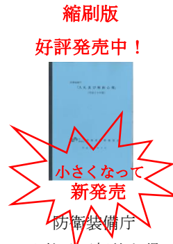
防衛装備庁 入札及び契約心得 (平成 30 年版)

A 5 版(新発売) 1,000 円 (税込) A 4 版も取扱中 1,500 円 (税込)