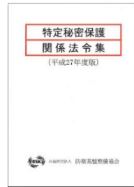
特定秘密保護 関係法令集 (平成 27 年度版)