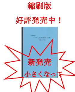
防衛装備庁 「入札及び契約心得」 (平成 30 年版)