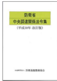
防衛省 中央調達関係法 令集(平成 30 年 改訂版)