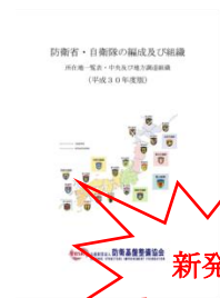
防衛省・自衛隊 の編成及び組織 (平成 30 年度版)