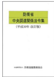
防衛省 中央調達関係法 令集(平成 30 年 改訂版)