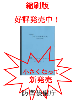
防衛装備庁 入札及び契約心得 (平成 30 年版)

A 5 版(新発売) 1,000 円 (税込) A 4 版も取扱中 1,500 円 (税込)