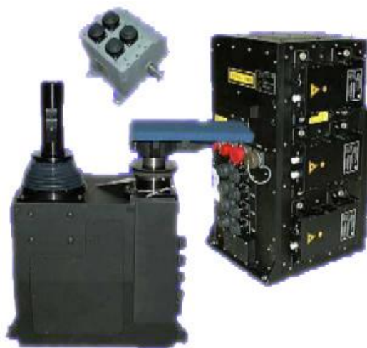
図 5 光操縦装置