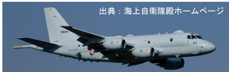
図1 P-1 哨戒機

当該機の開発当初、FBL方式の最重要機器の一つであるE0(Electrical/Optical)トランシーバ(以下EOT)には航空機に搭載可能な高品質及び高信頼性の既製品が存在しなかったため、光技術で実績のある弊社が実用量産可能なEOTの開発をご指名頂くことになった。